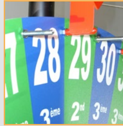
de 6 à 36 sections