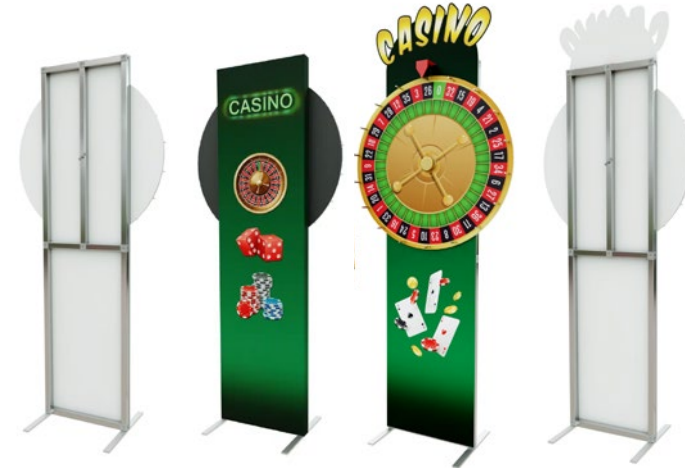
verso sans habillage