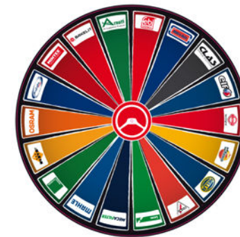
exemple de roue à 18 sections