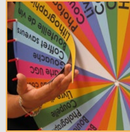
version plateau magnétique