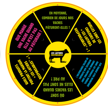
exemple de roue à 6 sections