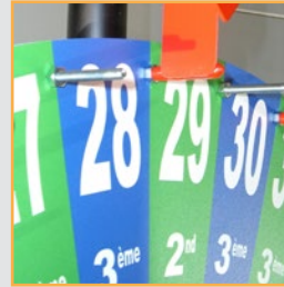
de 6 à 36 sections