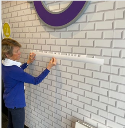
1 - Mettez en place le gabarit avec du ruban adhésif.