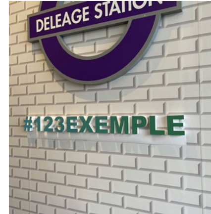
3 - Retirez le gabarit.