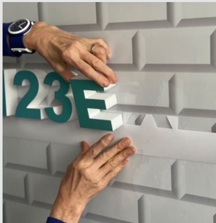
2 - Collez les lettres une à une en faisant coïncider le bas de vos lettres avec le gabarit.