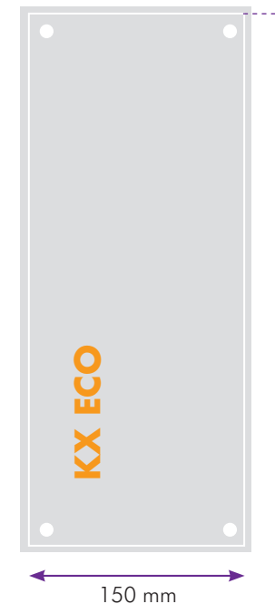
Format maquette au 1/4