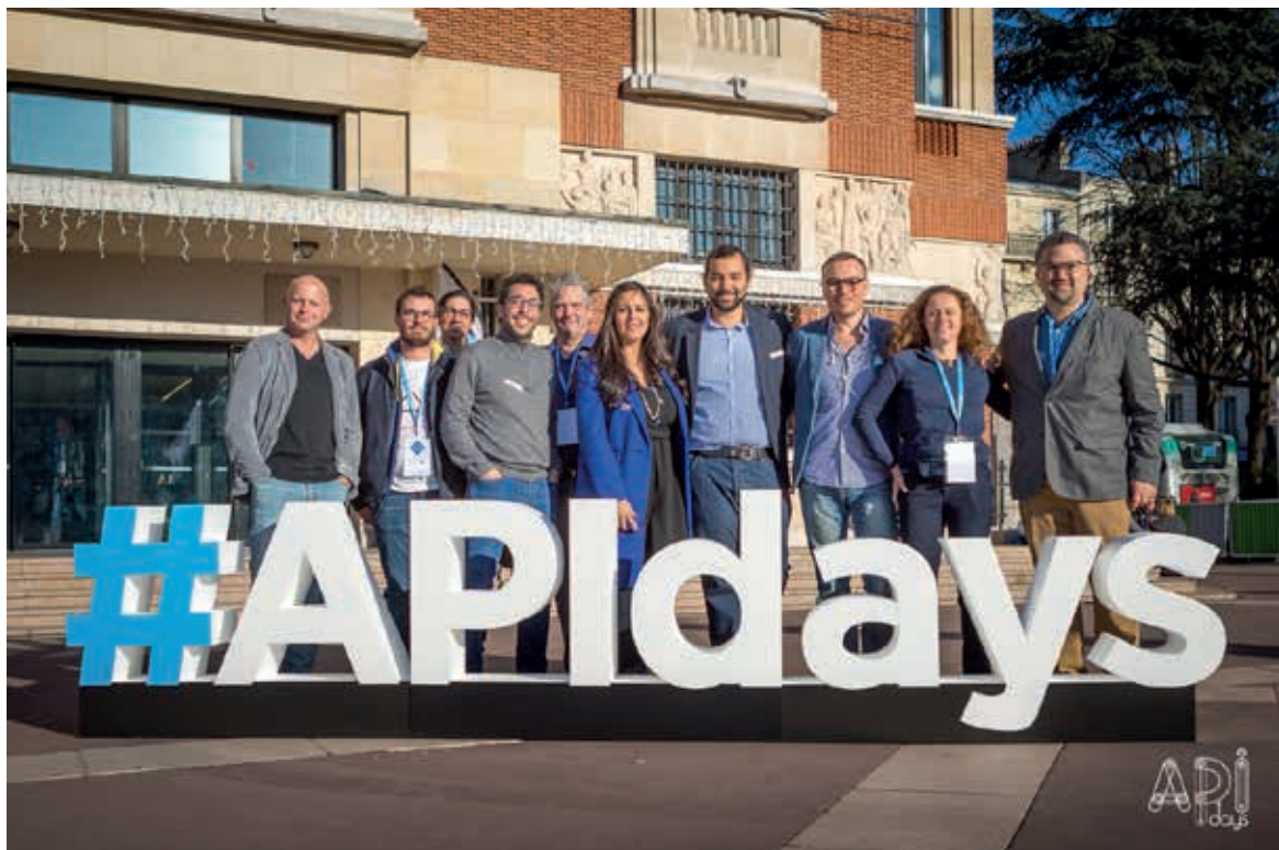
Lettrage en polystyrène sur socle avec facing PVC