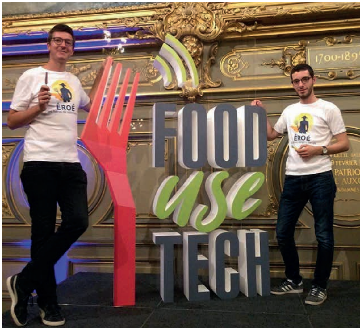
Logo en volume sur plaque plexiglass transparente