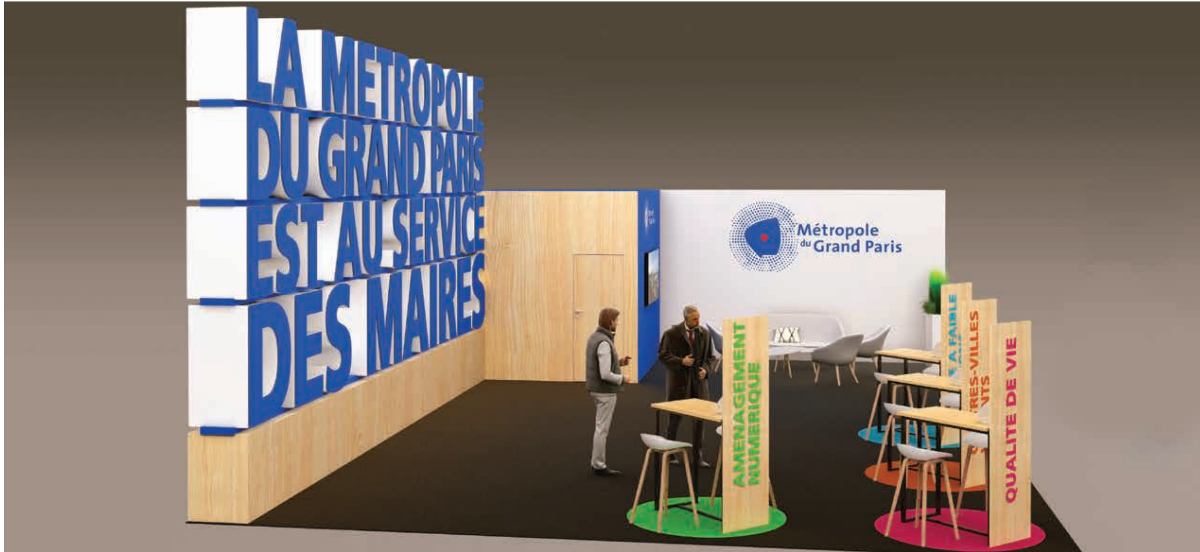
Mur en claustra réalisé en lettrage polystyrène avec façing PVC imprimé