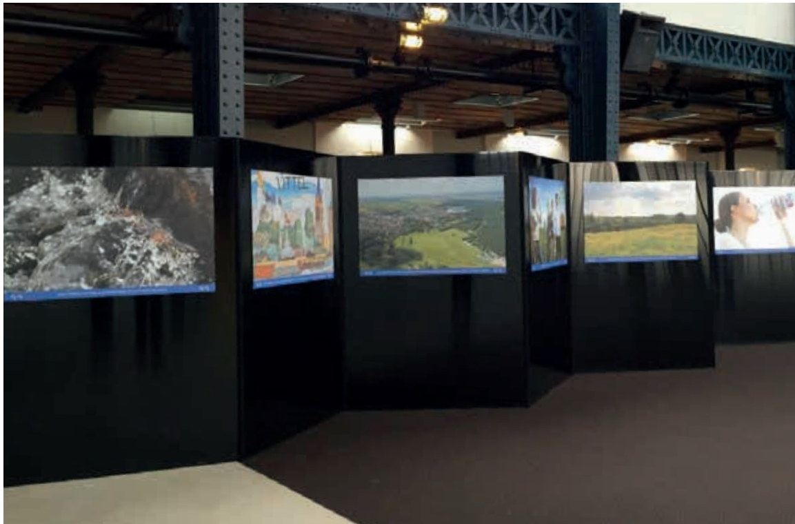
Exposition complète ZIG-ZAG®