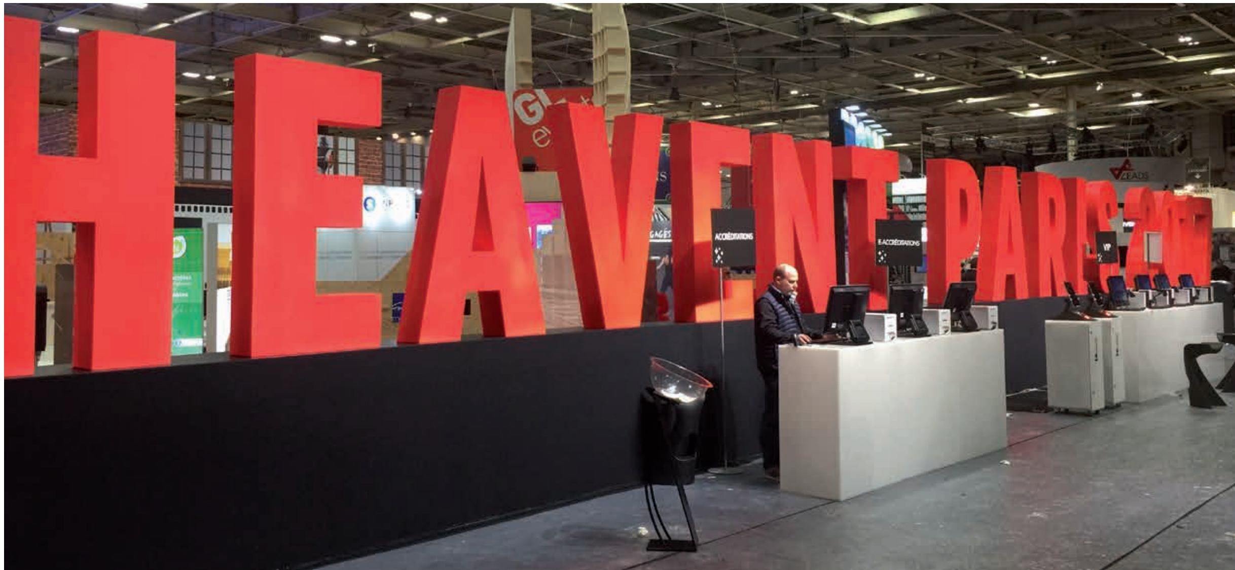
Lettrage en polystyrène avec laquage complet