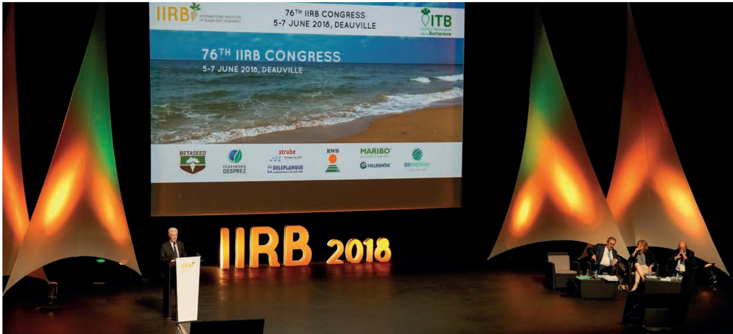
Lettrage en polystyrène blanc avec éclairage de couleur