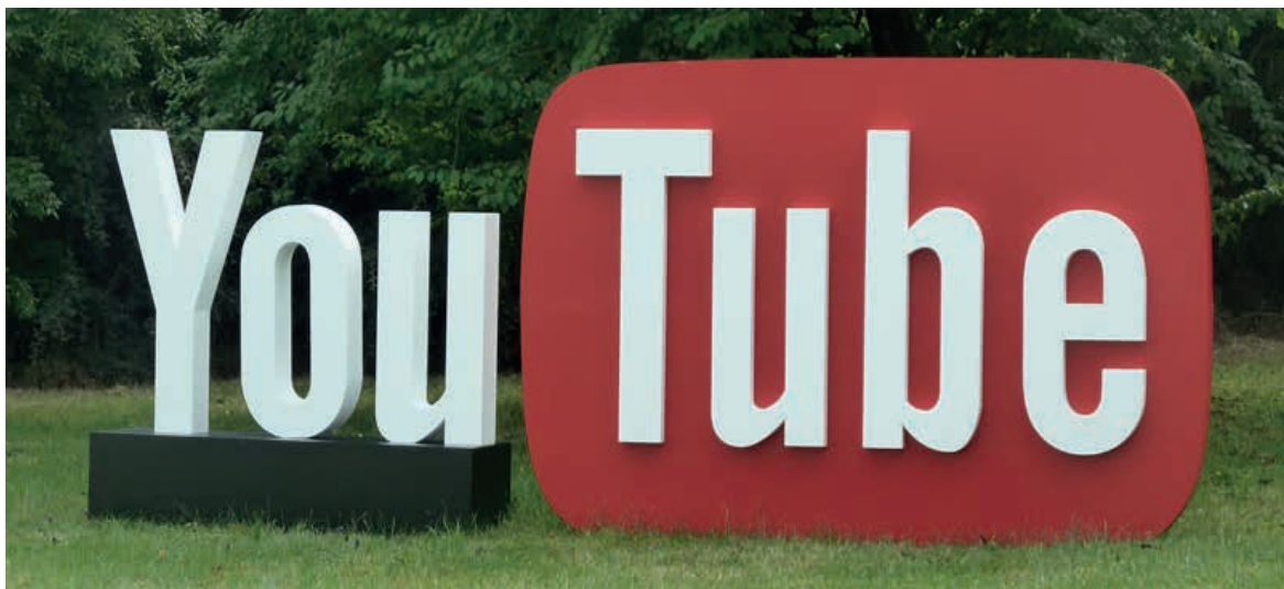
Logo polystyrène lesté pour l'extérieur