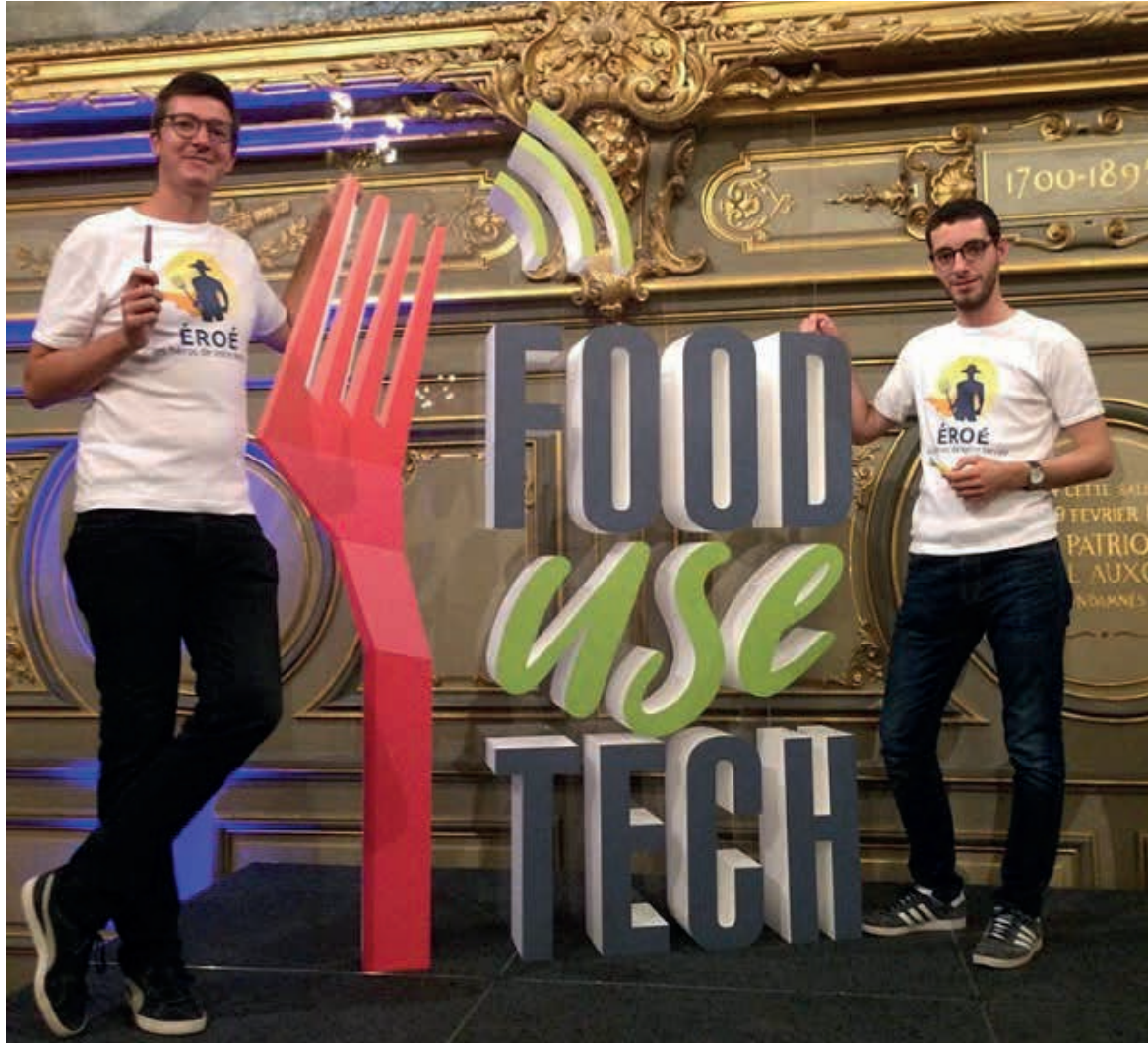
Logo en volume sur plaque plexiglass transparente