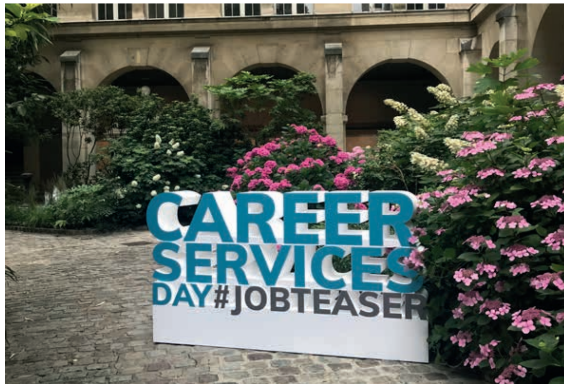
Lettrage en polystyrène sur socle avec facing PVC