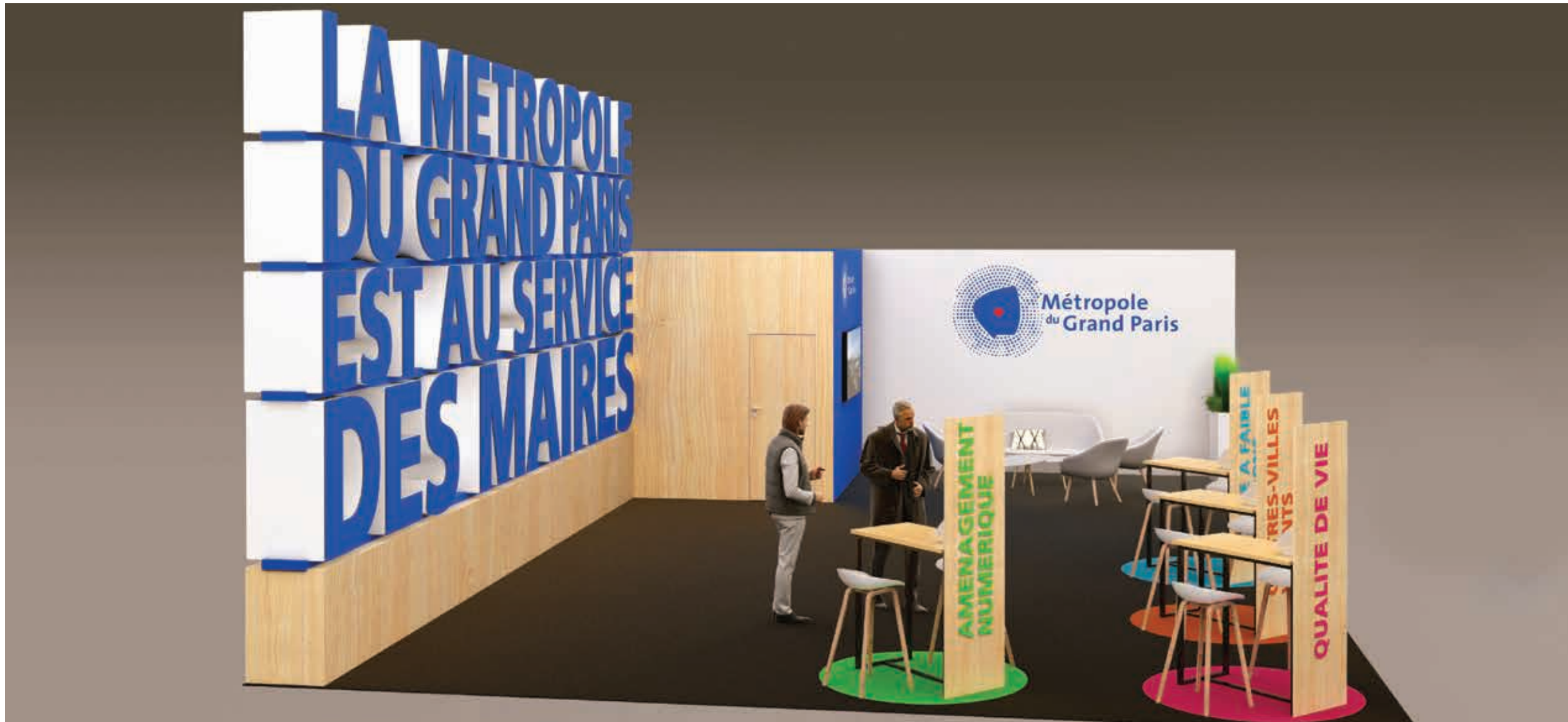
Mur en claustra réalisé en lettrage polystyrène avec façing PVC imprimé