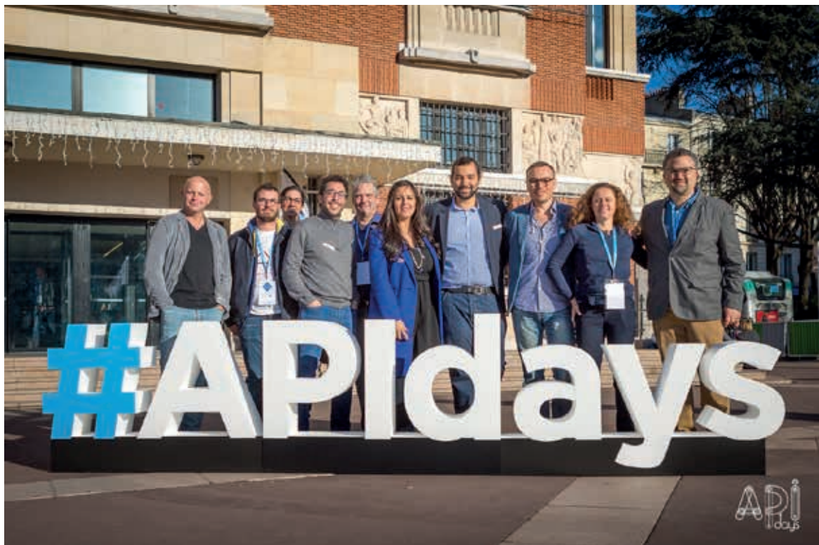
Lettrage en polystyrène sur socle avec facing PVC