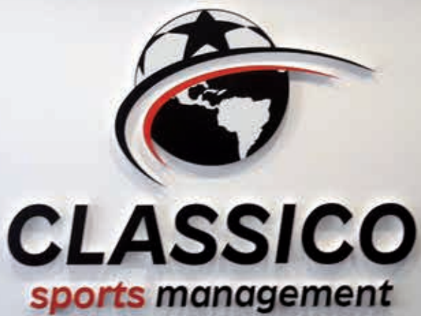
Logo mural polystyrène avec facing PVC