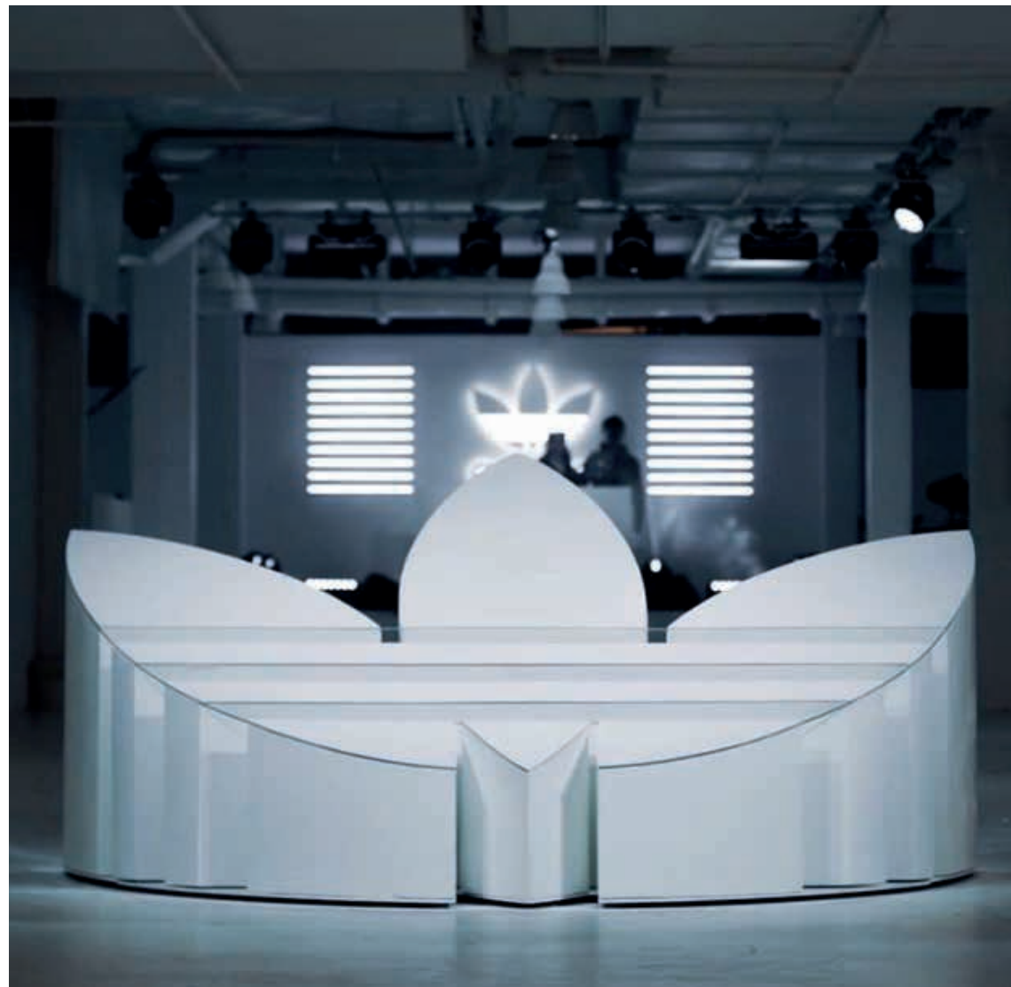
Podium polystyrène stratifié et plexiglass